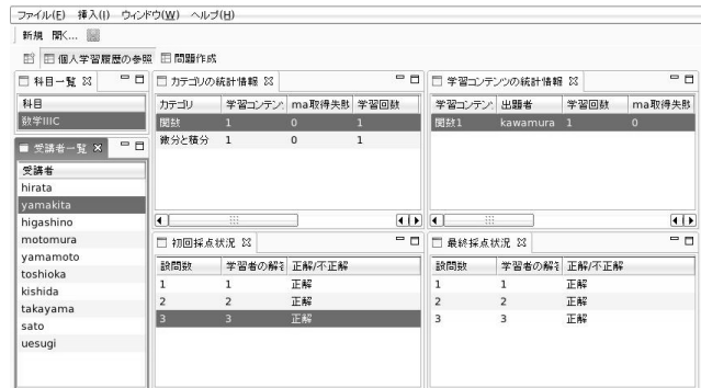
図 3: 教師用インタフェースの学習履歴閲覧画面

い学習者を選択する。その依頼が IA を通じて、対象の学習者の UA に送られ、UA は保持している学習履歴を IA に返信する。IA は受け取った学習履歴を教師用インタフェースに提供する。以上のような通信を経て、教師は学習履歴を閲覧する。教師用インタフェース上で学習履歴を閲覧する様子を図 3 に示す。